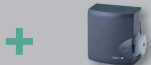
3 x čidlo otopné vody a další příslušenství ...